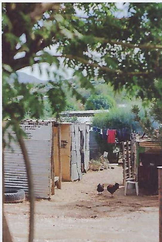
Bosättningarna i Katutura lider stor brist på grundläggande rättigheter som vatten och sanitet.

Elsie Hlahlas arbetsroll kräver många kvaliteter som inte har med en sjuksköterskas medicinska kunskaper att göra, till exempel