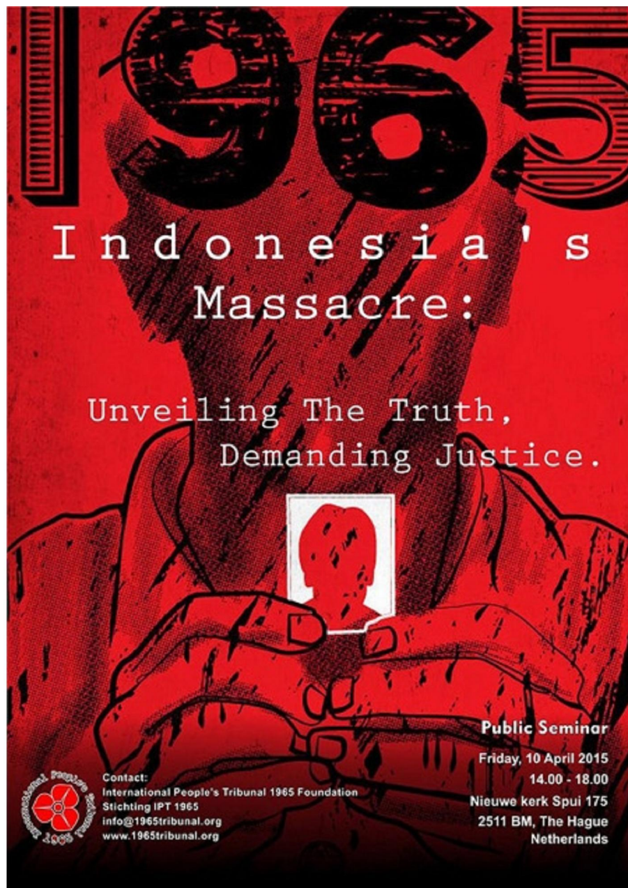
Broschyr för seminariet 10 april.