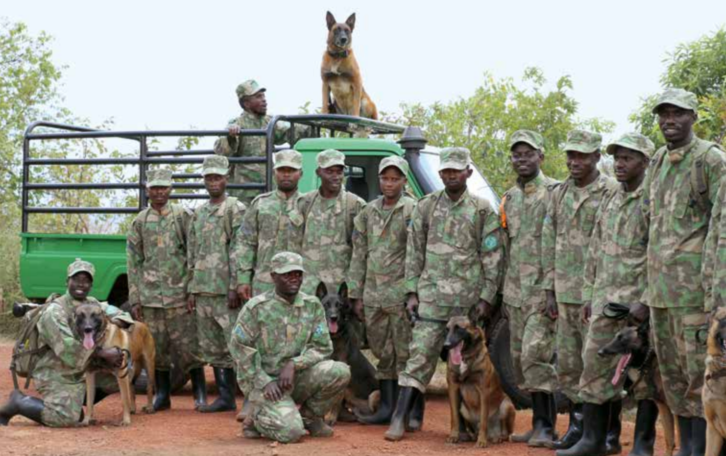
Gruppen af vagter i Akagera National Park har succes med at inddrage hunde i kampen mod krybskytter.