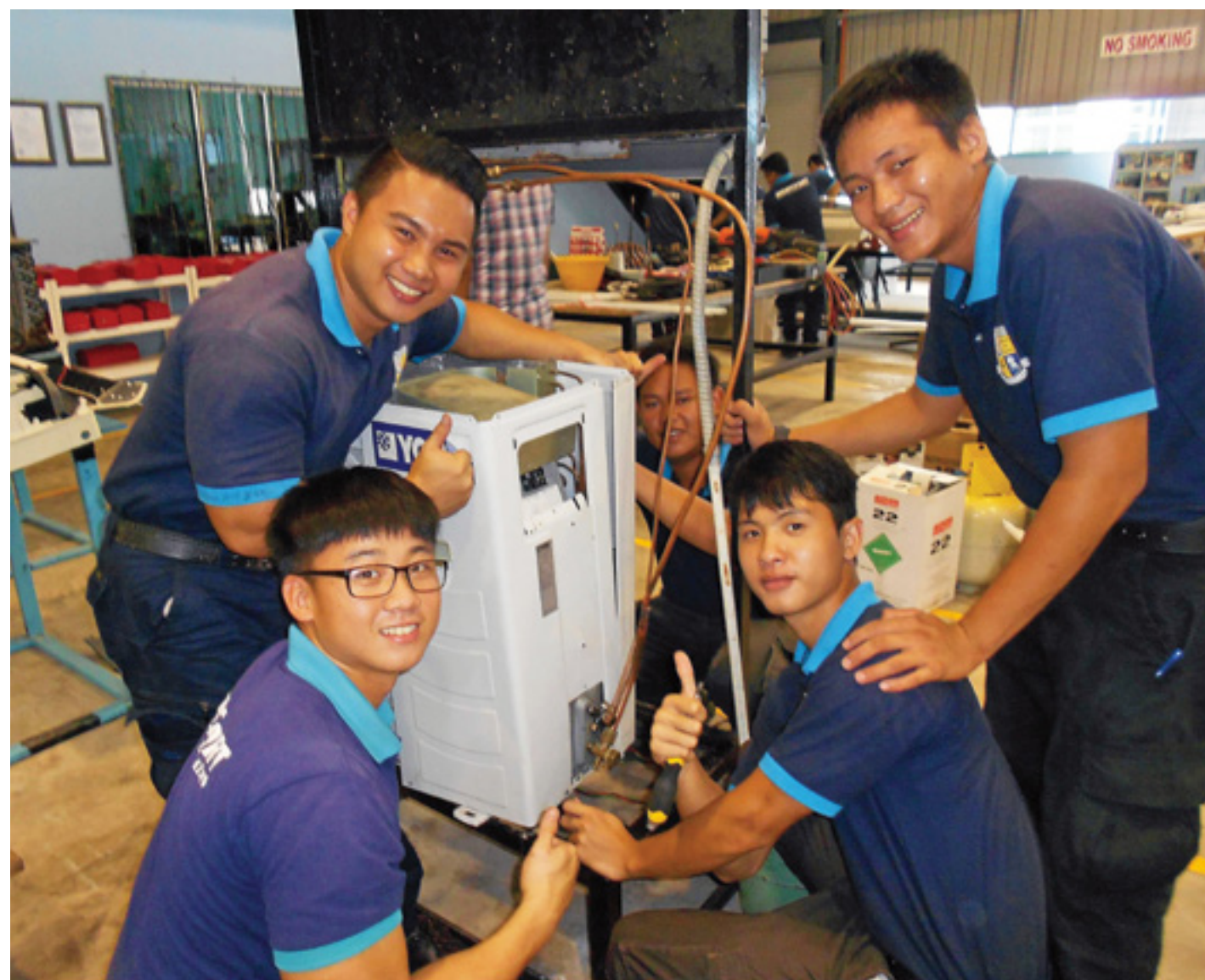
Hopp om en ljusare framtid. Det katolska ungdomscentret Montre, strax utanför huvudstaden Kota Kinabalu i delstaten Sabah på Borneo, erbjuder gratis yrkesskola för pojkar som tillhör Borneos stamfolk. Deras familjer är oftast mycket fattiga och barnen riskerar därför att bli utan utbildning och hamna i en ytterst besvärlig livssituation i det moderna samhället.