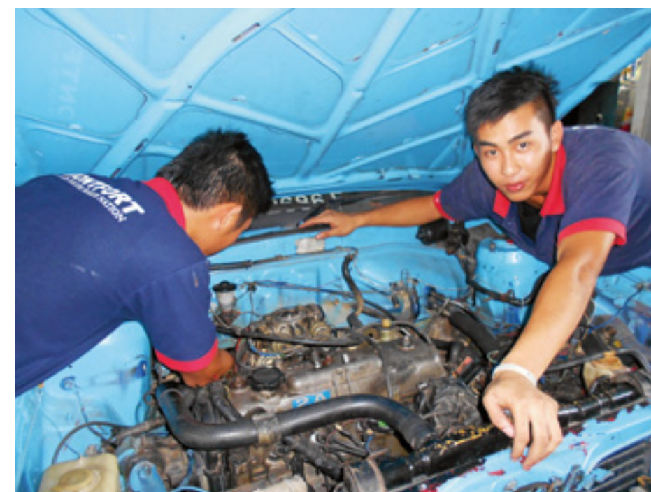
Yrkesinriktning. På ungdomscentret undervisar man i praktiska ämnen som snickeri, bilmekanik, svetsning och luftkonditionering, men också i matematik, IT och engelska.